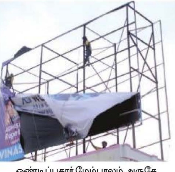
ஒண்டிப்புதூர் மேம்பாலம் அருகே அனுமதியின்றி வைக்கப்பட்டிருந்த விளம்பர பதாகையை அகற்றும் பணியில் சனிக்கிழமை ஈடுபட்ட மாநகராட்சி ஊழியர்கள்.

சிங்காநல்லூர் உள்ளிட்ட பகுதிகளில் அதிகப் படியான விளம்பரப் பதாகைகள் அகற்றப்பட் டுள்ளன. மேலும், சில இடங்களில் அனுமதி யின்றி வைக்கப்பட்டுள்ள விளம்பரப் பதாகை களை அகற்ற நோட்டீஸ் வழங்கி 5 நாள்கள் அவகாசம் அளிக்கப்பட்டுள்ளது. 5 நாள்களில் அகற்றப்படாவிட்டால் சம்பந்தப்பட்டவர்கள் மீது சட்டப்படி நடவடிக்கை மேற்கொள்ளப்ப