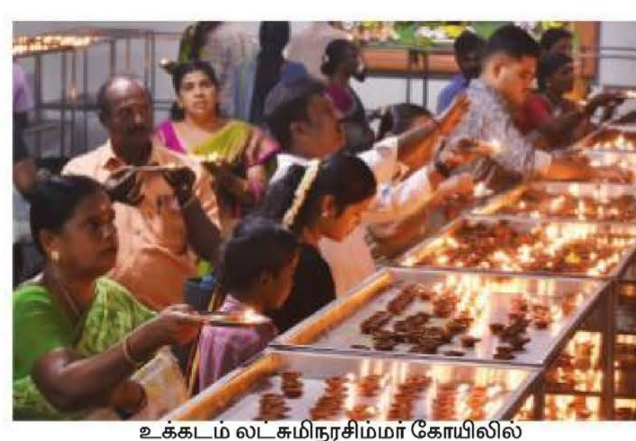
சனிக்கிழமை விளக்குகள் ஏற்றி வழிபட்ட பக்தர்கள்.

ஷார்ப் நகர், மகேஷ்வரி நகர், குமுதம் நகர், செங்